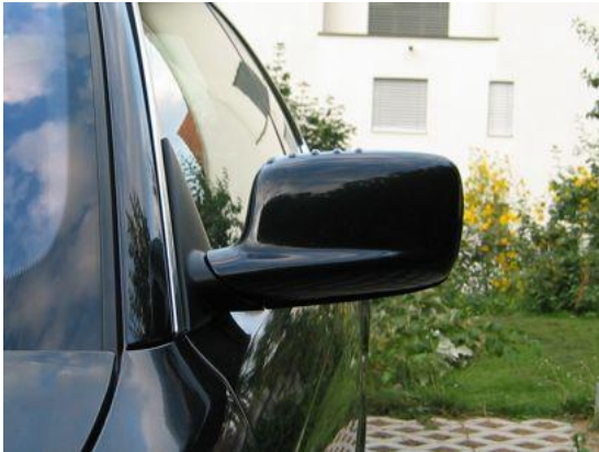
E46 Coupé / Cabrio Serienspiegel