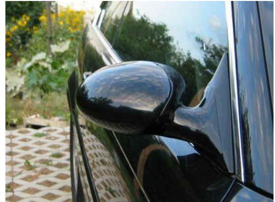
E46 M3-look Spiegel